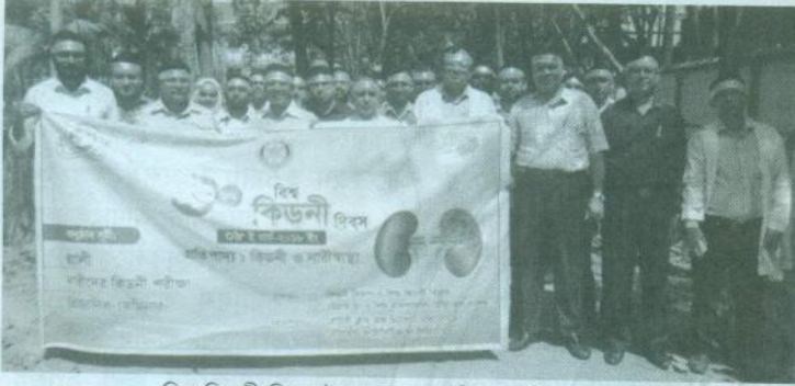
বিশ্ব কিডনী দিবস উপলক্ষে আয়োজিত র্যালির একাংশ।